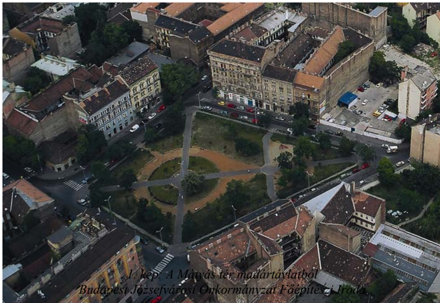
1. kép: A Mátyás tér madártávlatból Budapest Józsefvárosi Önkormányzat Főépítési Irodája

után a Mátyás téren is megindult a városias építkezés. Már nem falusi jellegű, hanem klasszicista, ún. polgárházak épültek. Kivételt képez például a Mátyás tér 2. számú ház, mely a 19. század végén barokk stílusban épült.