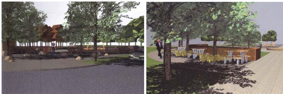
2. ábra: A megújult Mátyás tér látványtervei Budapesti Corvinus Egyetem / Rév8 Zrt.

Voltak mindenki által elfogadott sarokpontok: nyilvános WC szükségessége, minden korosztály számára vonzó funkciók elhelyezése, elkerítés és őrzés. A három előzetes tervezetből született meg a Mátyás tér végleges terve, mely ötvözte a három korábbi alternatívát. A látványtervek az alábbi képeken láthatók.