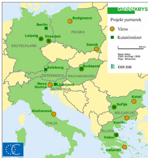
3. térkép: A GreenKeys Projekt partnerszervezetei Szerk.: Insitut für Ökologische Raumentwicklung

Rév8 Zrt és MTA FKI feladata a GreenKeys projektben egyrészt egy zöldfelület-fejlesztési mintaprojekt megvalósítása – Mátyás tér –, másrészt ezzel párhuzamosan egy a terület egészére kiterjedő javaslat kidolgozása egy zöldfelületi stratégiára vonatkozóan.