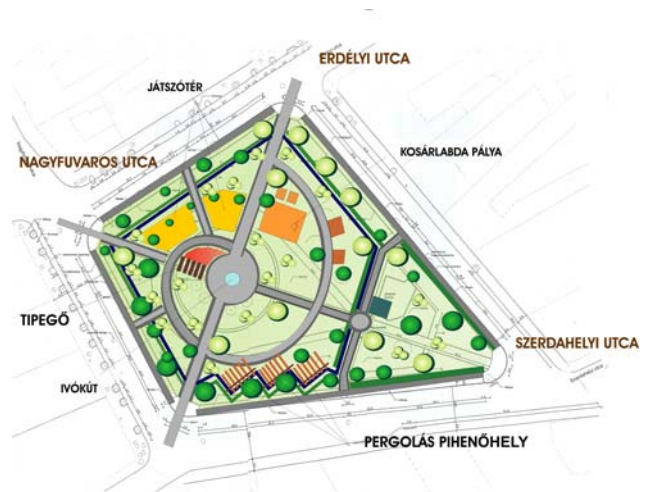
1. ábra: A vázlattervek egyike Budapesti Corvinus Egyetem / Rév8 Zrt.

A tér megújításának műszaki terve egy éven át tartó egyeztetést követően készült el. 2005. őszén egy kétnapos szabadtéri rendezvény keretében a Mátyás téren hirdettük meg a programot, tájékoztattuk az érdeklődőket a program alapkoncepciójáról, céljainkról. Ezt követően a helyi sajtóban, illetve honlapokon tettünk közzé felhívást a tér megújítására vonatkozó igények, vélemények feltárása céljából. Az MTA FKI koordinálásával közel fél évig gyűjtöttük a térre vonatkozó helyi elképzeléseket kérdőívek segítségével is – a budapesti Eötvös József Tudományegyetem geográfus és szociológus hallgatóinak bevonásával -, miközben az első eredményektől kezdődően rendszeres lakossági találkozók keretében, széles körű nyilvánosság előtt készült el kezdetben az a három vázlat, térhasználati funkcióterv, amelyek az eltérő lakossági véleményeket próbálták három különböző alternatívába rendezni (1. ábra).