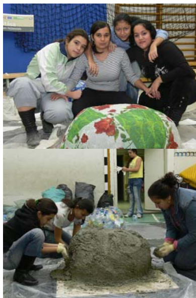
2-3. képek: Ülődomb műhely, 2006. Budapesti Corvinus Egyetem / Rév8 Zrt.

A kivitelezés első lépéseként műhelymunka keretében tanárok, diákok, tájépítészek, lakók részvételével készültek speciális utcabútorok (ún. ülődombok v. ülögumók) újrahasznosított anyagokból a megújuló térre. Az utcabútorok a sokszínűség megőrzése, az időtaláltság jegyében születtek, miközben terepet adott a fiatalok számára az együttgondolkodásra, a kreativitásra.