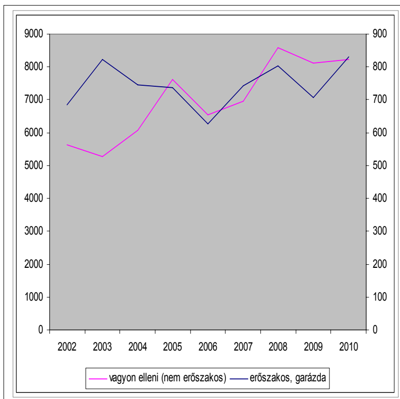
2. ábra Az erőszakos és garázda jellegű, az ismertté vált vagyon elleni (nem erőszakos) bűncselekmények százezer lakosra jutó száma Józsefvárosban 2002-2010 között

*Az ábrán két eltérő skálabeosztású ordináta (y tengely) szerepel. A jobb oldali az erőszakos cselekmények arányszámát jelzi 100 ezer lakosra, amelynek beosztása 1/10-e a baloldalon jelzett vagyon elleni cselekmények arányszámát jelző skálabeosztásnak.